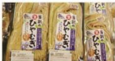
生ひやむぎ 1袋 160円