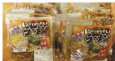
当別産ラーメン 1袋 180円