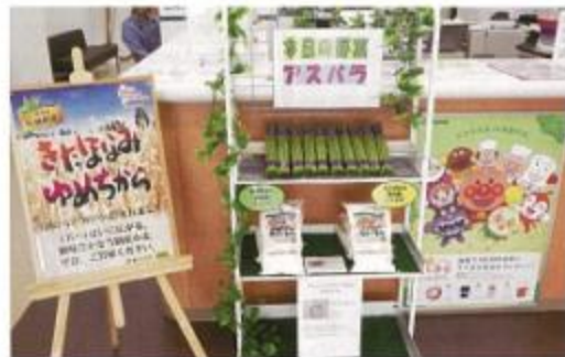
西当別金融店舗 野菜販売スペース

また、当別産の小麦商品の販売も行っていますので、西当別金融店舗へお越しの際は、ぜひ足を止めてみて下さい。