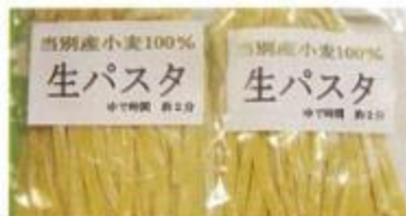
生パスタ 1袋 150円