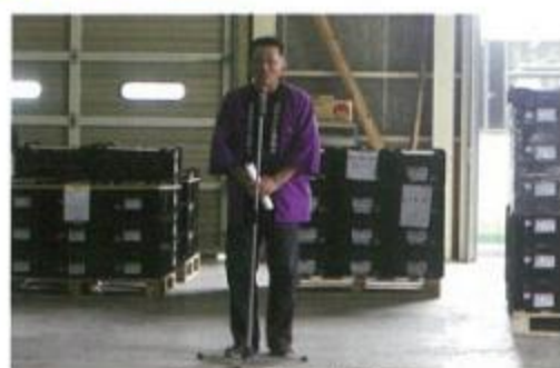
挨拶する才田組合長