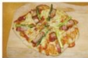
当別ふれあいピザ 980円 (お持ち帰り可 プラス50円)