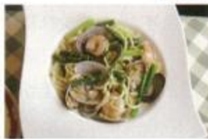
当別産小麦のパスタ