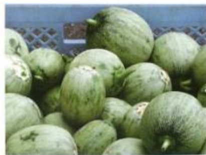
漬物用のすぐりメロン

興味のある方は、おいしいメロンを味わう前に、すぐりメロンの漬物作りに挑戦してみてください。