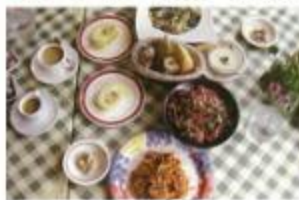
パスタセット 1,470円 (写真は2人前)