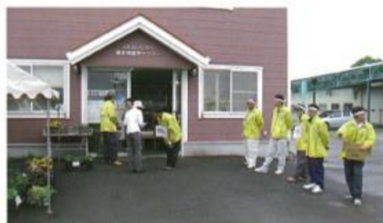
青年部ピラ配りの様子