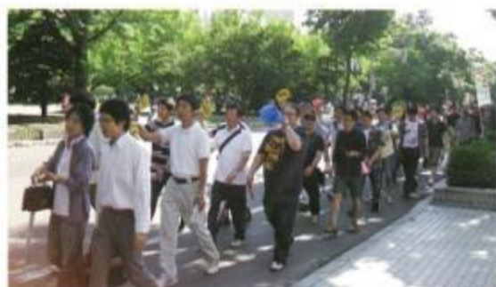
デモ行進で声を張るJA職員