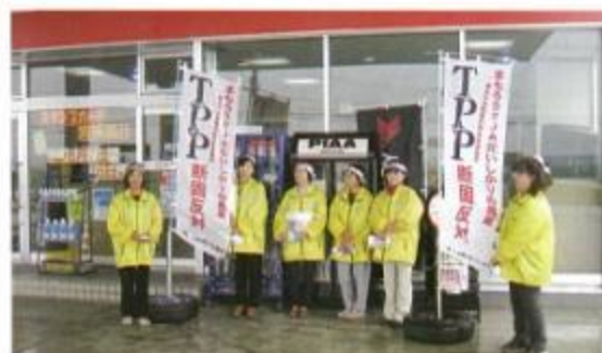
女性部ピラ配りの様子

当日はあいにくの天候ではありましたが、女性部員・青年部員ともに訪れたお客さんに対して、TPPについて考えてもらうよう訴えていました。