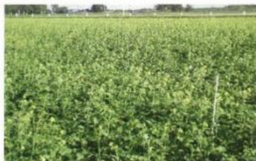
H24年北いしかり管内チャガラシ生育状況

窒素・燐酸・カリで各8kg/10a前後(硫安又はNK20でも施肥は可)圃場の地力に合わせて加減してください。