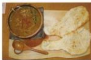
当別産小麦で作る ナンカレー 1,000円 (ハーフ500円)