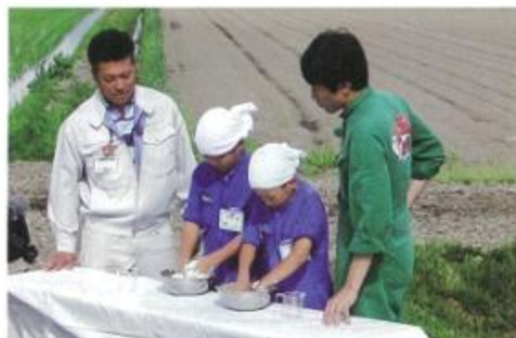
小麦粉の説明をする才田職員