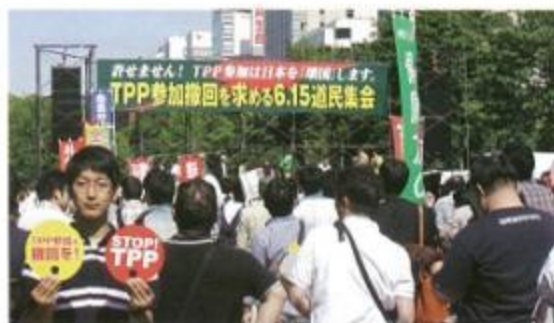
JA職員もうちわを持ってアピール

閉会後のデモ行進では、当JA職員も「STOP!STOP!TPP」と声を張りTPP参加撤退を求めています。