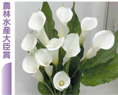
農林水産大臣賞 渡 政幸