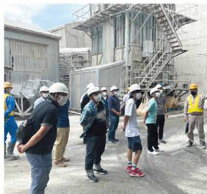
北海道肥料製造工場