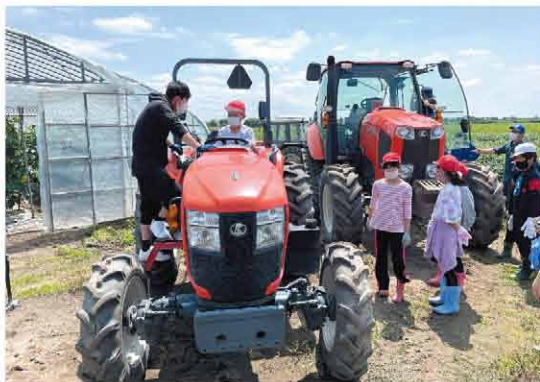
トラクターに試乗する生徒たち

JA北いしかり青年部は、7月19日に大塚農場さんの圃場にて、とうべつ学園4年生49名と西当別小学校4年生27名を対象に子ども農業体験を行いました。前回実施した大豆播種編に続き大豆管理作業編と題し、6月に生徒たちが播種した圃場の草取りやトラクターの試乗等を体験し、また今回の試みとして、青年部員によるスタブルカ