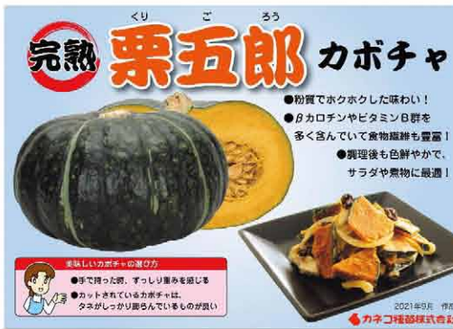
カネコ種苗の代表的な品種 栗五郎 栗五郎の作付面積は全体の6割にも及ぶ