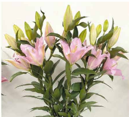
審査特別賞 木屋路 尚史 ユリ(バンドーム)