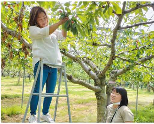
女性部サクランボ狩り

恒例となっている部員交流会の「サクランボ狩り」はこの2年間、新型コロナウイルスの影響で中止。3年ぶりの開催となりました。この日を待ちに待った部員は、時間の許す限りサクランボ狩りを楽しみました。昼食後にはビンゴゲーム大会が行われ、景品には手作りのみそや善盛園の梅干し、ジャム等が用意され、農繁期を前に楽しい時間を過ごしました。