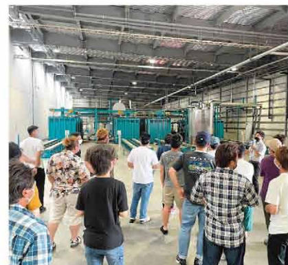
七飯町集出荷予冷施設内