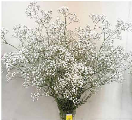
金賞 才田 正 カスミ草(ベールスター)