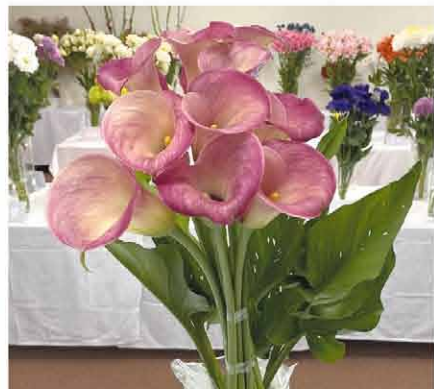
金賞 山脇 正春 カラー(キャプテンロマンス)