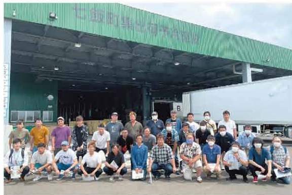
集合写真 七飯町集出荷予冷施設にて

JA北いしかり青年部は7月11日(月)～12日(火)にかけて視察研修を行いました。2年ぶりの開催となり、待ち望んでいた研修に部員たちは喜びの表情を浮かべていました。1日目は北海道肥料株式会社 社の製造工場(室蘭市)を視察。2日目は2019年に完成したJA新はこだて七飯町集出荷予冷施設を訪れました。