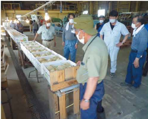
規格の目合わせを行う生産者

7月3日、厚田メロン生産組合は望来野菜集出荷共選施設にて共選作業を開始しました。開始日には出荷に先立ち、市場関係者を招き、共選規格の確認や糖度測定等の目合わせが行われました。 初出荷は昨年実績(86ケース)を大きく上回る237ケースとなり、規格品質は4玉・5玉中心で秀品が多く、秀品5玉、4、500円・秀品4玉、4、000円と幸先良い相場となりました。担当職員「よめる」一昨年末