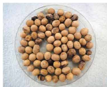
写真：大豆腐敗粒(中央農試原図)