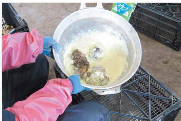
大きな鍋を使って農薬をまんべんなく塗していく