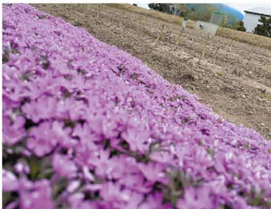
芝ざくらとアスパラ