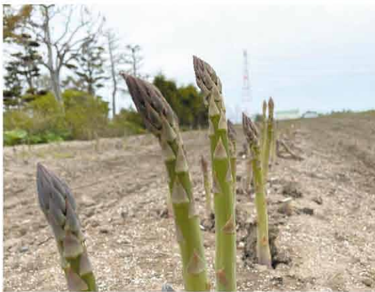
季節を告げるアスパラが顔を出す

担当職員によると、「3月の気温が高く推移した為、例年よりもスタートは好調。毎年北いしかり産のアスパラを心待ちにしている消費者がたくさんいらっしやるので、一日でも早く食卓へお届けしたい」との事で、今年の作付面積は約20畝、出荷予定数量は28トンを計画しております。出荷のピークは5月末頃で、共選作業は6月末までの予定です。