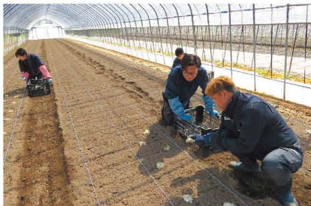
真剣に説明を聞き丁寧に植付作業をする実習生