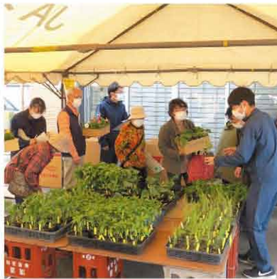
お会計待ちの列が できるほどの賑わい

5月18日、19日の2日間 にわたり、購買部生産資材店舗前 にてJA園芸市が開催されまし た。店頭には、トマト、アスパ ラ、キュウリ、バジルなどの野菜 苗や、バラなどの花苗が100円 〜300円の価格帯で提供され ました。