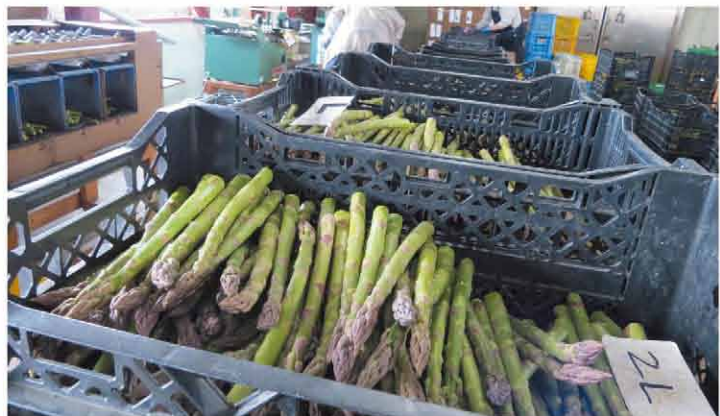
統一された長さにカットされ規格ごとに分けられる