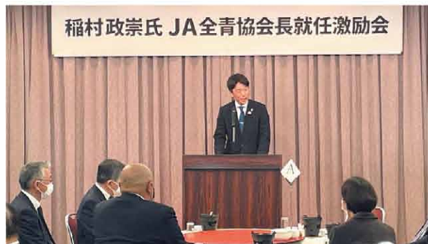
就任の決意を述べられる稲村政崇氏