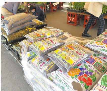
併せて陳列された各種肥料

5月18日、19日の2日間 にわたり、購買部生産資材店舗前 にてJA園芸市が開催されまし た。店頭には、トマト、アスパ ラ、キュウリ、バジルなどの野菜 苗や、バラなどの花苗が100円 〜300円の価格帯で提供され ました。