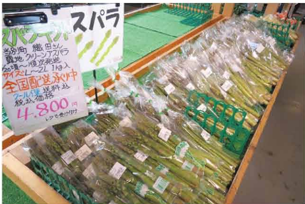
旬のアスパラが並ぶ

今後は、6月から11月にかけて「父の日フェア」や「プロッコリーフェア」とうべつ花卉展示会「感謝祭」など各種イベントを実施する予定です。