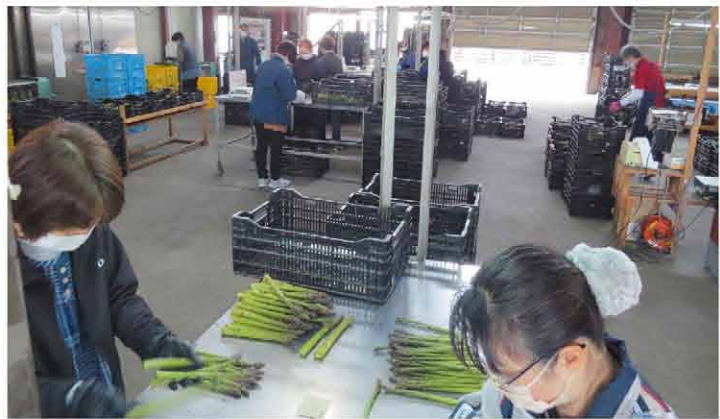
アスパラを1本1本丁寧に選別する