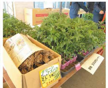
アスパラやキュウリ等の野菜苗