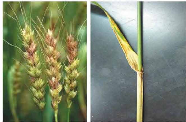
赤かび病の発病穂