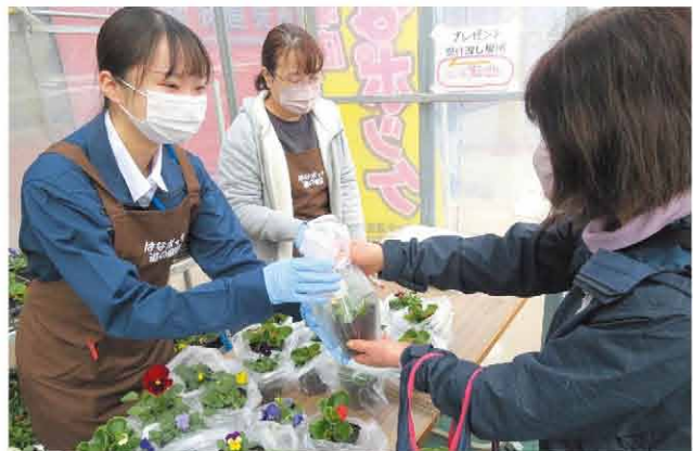
花苗のプレゼント