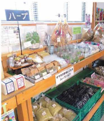
ハーブソルトなど珍しい商品も陳列