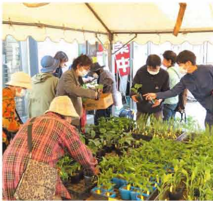
たくさんのお客様で設営された テント内はいっぱいに