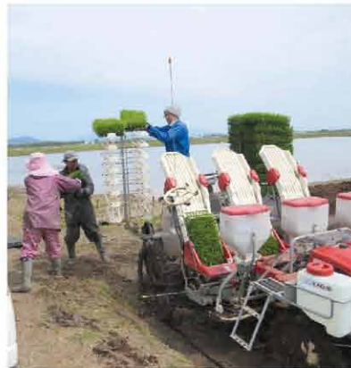
苗を丁寧に積み込む