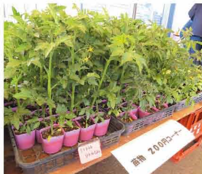
ミニトマトやバジル等の 野菜苗が並ぶ