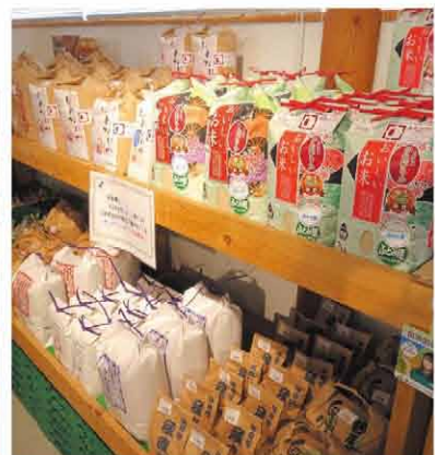
JA北いしかり産のお米