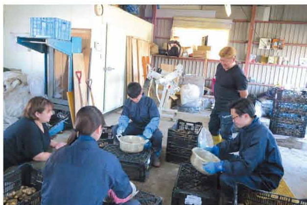
カラーの球根に農薬を塗す