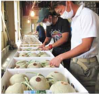
規格の目合わせを行う生産者

同組合の今年度の共選予定数量は70 ト 。取扱品種は「ルピアレツド」から始まり、「レッド113 U」、「レッド113」の順で10月末まで続く予定となっております。