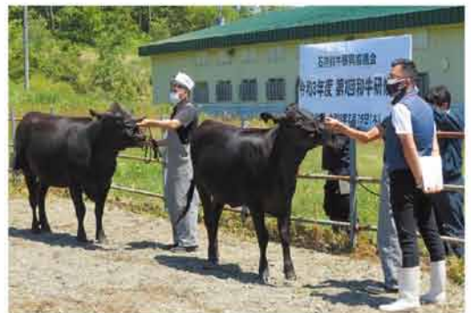
最高位賞を受賞した酪農学園大学の出品牛

には1席を獲得した牛の中から未経産の部・経産の部それぞれ最高位の審査を行いました。