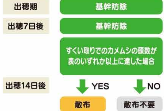
図1 すくい取り方法による斑点米カメムシの防除体系