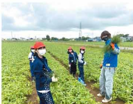
手取り除草を行う児童たち

部員から写真や図を用いて、雑草が大豆に及ぼす影響や防除に用いる作業機械の説明が行われた後、トラクターの試乗や、圃場での手取り除草を体験しました。児童は慣れない手つきながらも、部員のアドバイスに従い真剣に作業に取り組みました。 今回は10月に「収穫作業編」が実施される予定です。