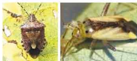
写真:大豆を加害するカメムシ類(一部抜粋) 左:ブチヒゲカメムシ、右:ナカグロカスミカメ