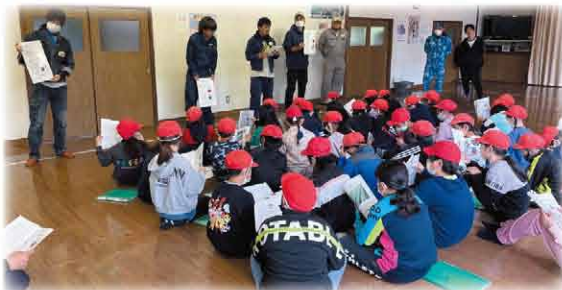
播種後大豆についての座学を実施

次回、7月上旬頃にとつづつ学園 西当別小学校両校を対象に「大豆管理作業編」を開催する予定です。