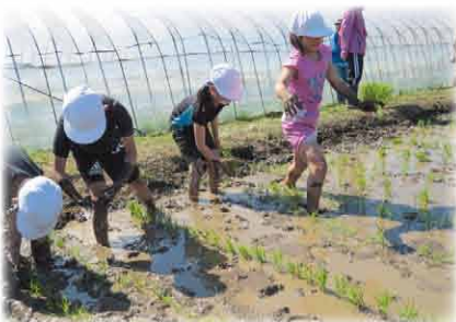
少し肌寒かったです、みんな元気に植え付けていました。

に「大豆播種編」を行いました。児童たちは普段なかなか体験することのできない「田植え」や「大豆の播種」をとても楽しそうに体験されていました。