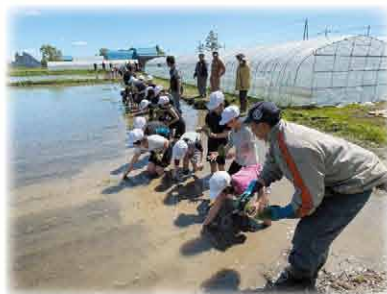
みんな一斉に植え付け開始