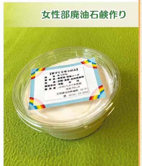
天然成分由来の石鹸