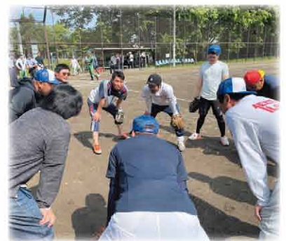
円陣で気合いを入れる

決勝でAチームと激突。北いしかり同士の対戦となりました。激闘を制したAチームが決勝に進出するも惜しくも江別チームに敗れ準優勝でした。 ソフト終了後は農協車庫にて懇親会(焼肉)を行い、盛り上げをみせました。