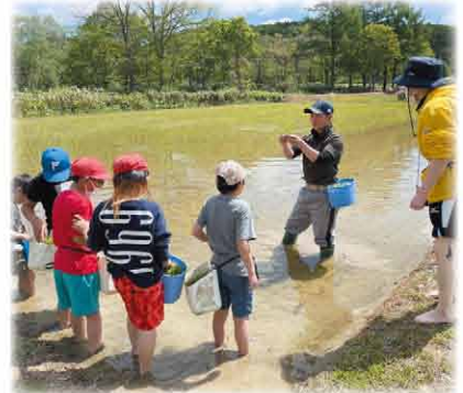
農家さんと同じ装備で準備万端

次回、7月上旬頃にとつづつ学園 西当別小学校両校を対象に「大豆管理作業編」を開催する予定です。