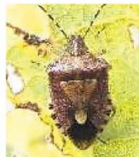
写真:フクガキカメムシ