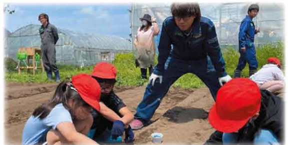
西当別小学校内の圃場に大豆を植えていく