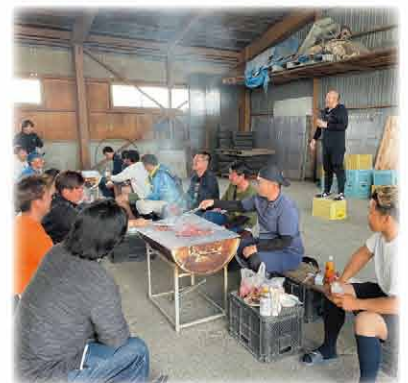
乾杯の挨拶をする森本部長