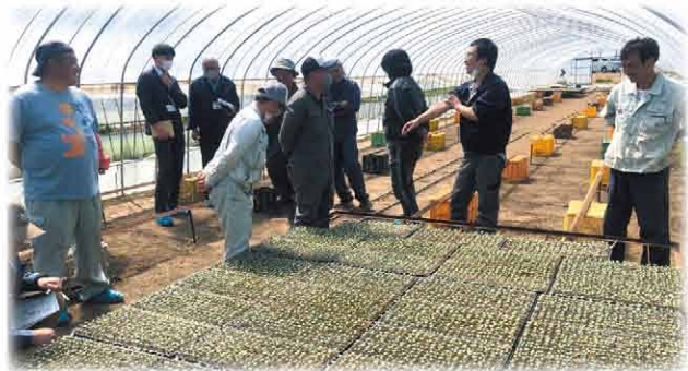
高岡地区 アグリヒルズ株さんの圃場

初出荷を前に良質なブロッコリー出荷に向け育苗巡回が行われました。生産者、職員（販売課・資材課）、普及センター、種苗会社、ホクレンたくさんの方々が参加されました。