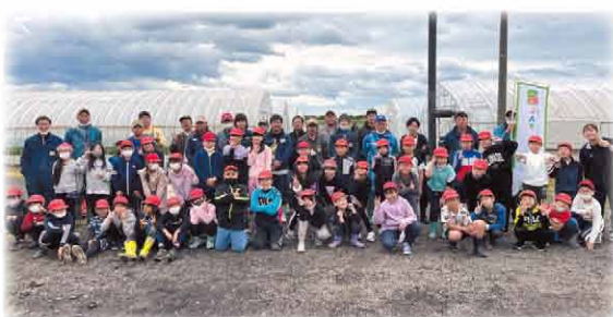
大豆播種体験集合写真（当別地区 大塚農場さんの圃場）