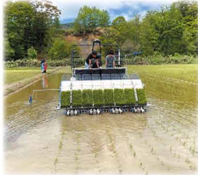
田植え機に乗せてもらい、稲が自動で 植付される様子に興味津々の子どもたち