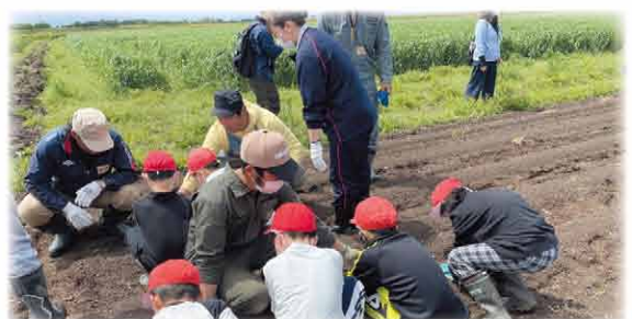
昨年に引き続き当別地区大塚農場さんの圃場に大豆を植えていく