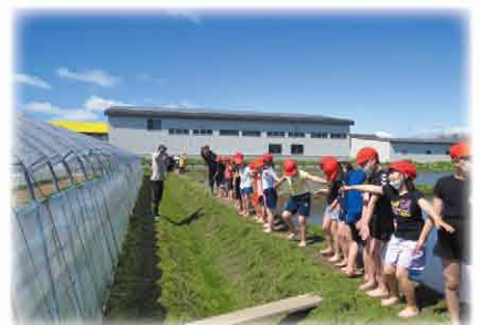
横一列に並んで田植えの準備