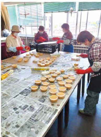
容器に原料を充填する部員たち

今回容器に充填された石鹸は約1カ月かけてゆっくりと固められ、当別道の駅内にある「JA直売所はなポック道の駅」や当別駅前の「れんが倉庫」等で販売予定です。