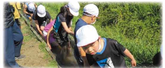
植付後水路にて体を洗うこどもたち