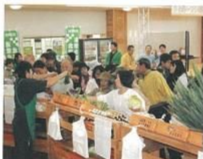
大盛況の農産物直売ブース

9月10日、11日の両日、さっぽろ圏地産地消推進委員会主催のさっぽろハーベストランド収穫祭が行われました。 開始時間の前から、会場となったさくらんど交流館の前には行列が出来るほどで、開始とともに大勢のお客さんが地場産の農畜産物を買って求めています。 会場には石狩管内のJAのブースが立ち並び、JA北いしかりからは南瓜や馬鈴薯、トマト、人参、メロンなどの農産物の他に、毎年大人気の焼きフランクを出品。あたりにはおいしい匂いが漂い、大勢の人が買い求めています。