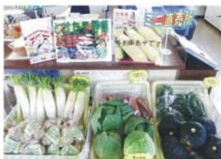
金融店舗内の直売スペース

9月26日から西当別支所金融店舗内で「とれたて野菜ミニ直売所」をオープンしました。 これは地域の皆さんに日頃の感謝をこめて、地場野菜を提供する目的で実施されており、月曜日から金曜日まで販売。 また、土曜日には「土曜日」として、西当別支所事務所前の駐車場にて朝9時から12時まで毎週、野菜の即売を行います。 金融店舗での直売所は10月末、土曜日は11月末まで開催する予定となっていますので、皆さん足をお運びください。