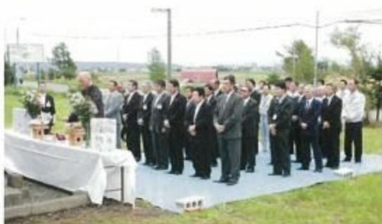
家畜達に感謝を込めて