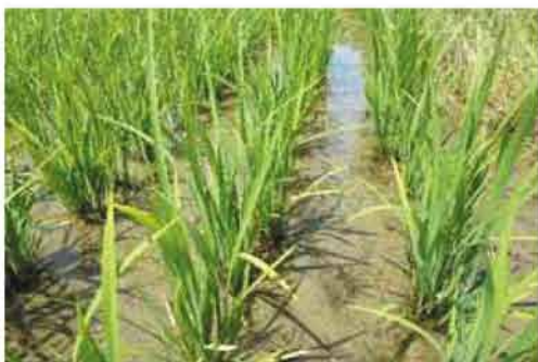
「CNペレット20」施用ほ場