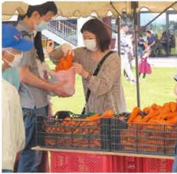
道の駅店での詰め放題イベントの様子

開業3周年を迎える「道の駅とつづつ」では9月中旬から周年祭が開催され、これに合わせて「はなポツケ道の駅」でも20日と26日に大収穫祭が行われました。シルバークイックに重なったこともあり、町内外から大勢の来場客が詰め寄せました。 店内には南瓜、馬鈴薯、大根、ナスなどといった秋野菜をメインに、収穫したての新米も陳列され、彩り豊かに商品ラインナップが充実しました。また、場内の中庭では人蔘、馬鈴薯、玉ねぎの詰め放題コーナーが設置され、来店者の反響を呼んでいます。 「はなポツケ上当別店」でも9月6日に毎年恒例の収穫祭が行われ、こちらの会場でも人蔘の詰め放題イベントなどが催され、常連客らで賑わいを見せました。