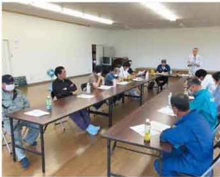
石狩市厚田区発足会館の様子

9月上旬、営農販売部営農企画課では、当別、西当別、厚田、浜益の各地区会館など計11会場において営農技術研修会を実施しました。 研修は収穫期を迎える水稲、大豆の適期刈取りに関する内容の他、秋まき小麦の播種に関連して、土壌の雑草対策及び透排水対策、また、pHの適正化など基本技術の確認を中心に行われました。 講義を行った主任技師からは、今年には好天に恵まれ水稲で平年より2〜3日早く生育が経過していることから、収穫適期を逃さないようアトバイスがありました。また、小麦の倒伏防止に向け、適期播種と適正播種量について説明がありました。