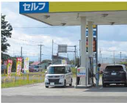
ホクレン当別SSの様子

当JA管内のホクレンSSにて、9月中旬の週末限定で、ガソリン・軽油を2千円以上給油したお客様にBOXティッシュやトイレットペーパーを進呈する「給油でプレゼントキャンペーン」を実施しました。 3カ所のSSで延べ6日間実施されたこのイベントでは、行楽地に向かう車両などが給油に訪れ賑わいを見せました。 なお、現在SSでは各種特典を設けた灯油定期配送の「得トクキャンペーン」や、入会無料の「店頭燃料割引&ポイントカード」の会員募集を実施しています。ご用命は店頭スタッフまでお気軽にお申し付けください。