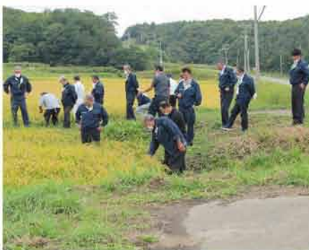
圃場で生育状況を確認する役員

9月11日、当JA役員による作況視察が行われ、当別地区では水稲（「えみまる」乾田直播）、西当別地区ではてん菜（「アンジー」直播）、厚田地区では水稲（「ゆめびりか」中苗マツト）、浜益地区では水稲（「ななつほし」中苗マツト）の作況圃を視察し、生育状態を確認しました。 現地では、各圃場毎に播種日や施肥量などが記された調書を片手に情報交換が行われ、参加した役員は、今後の収穫に期待を寄せながら視察を行っていました。 また、昨年共選ラインの増設と集出荷貯蔵施設を建設した南瓜共選施設の視察も行い、原料の品質や施設の稼働状況について確認が行われました。