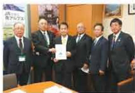
自民党 宮下農林部会長への要請

今後、要請内容や予算概要等の詳細は、JAグループ北海道農政NEWSウェブサイトに掲載しておりますので、ご確認願います。