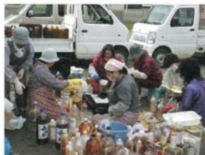
廃油を濾す女性部員

作られた石けんは約1か月かけてゆつくりと固められ、当別駅前のふれあい倉庫、太美駅構内のF・I・K・A、狸小路5丁目の道産プラザHUGで売られていますので、みなさんぜひ一度お試しください。