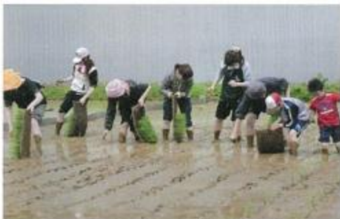
苗を植える参加者