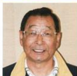
南都相談員 (考査役)