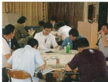
ポリシーブックの作成をする青年部員

取り上げられる議題は農業関係ではなくても良いと言うことで、いろいろな課題が提出され、発表し合っており、皆さんで課題の解決にあたりました。学習会後は交流会を開催。各ブロック間で交流を深めました。