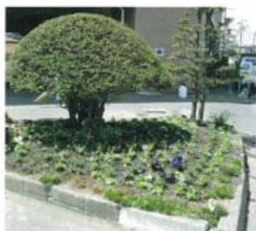
事務所前に植えられた花

この花植えは今年で6回目の開催で、廃タイヤを使ったプランターの他、たくさんのプランターが道路わきに置かれ、通行人の目を楽しませていきます。