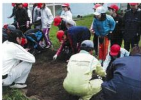
みんなで大豆の種植え

子供たちは青年部の方々の説明を聞きながら、一粒一粒をまいていき、芽が出る日を楽しみにしていました。