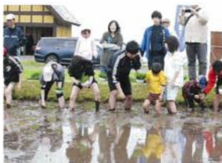
親子で仲良く田植え