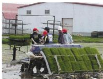
田植え機に乗る子供たち

中には泥に足を取られて転んでしまう子もいましたが、「でも、楽しい」と田植えを行いました。