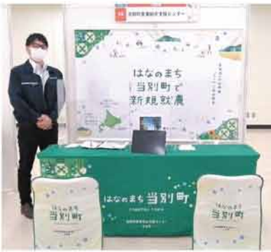
現地相談ブースの様子