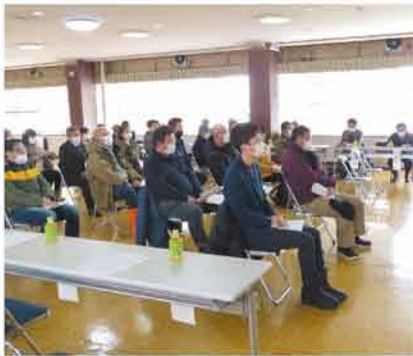
総会に出席する組合員