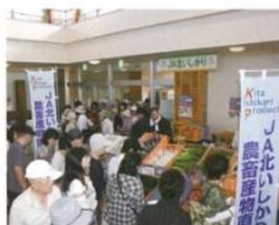
北いしかり産農産物を買求めるお客さん

9月8、9日の両日、サツボロさとらんどでさつぼろハーベストランド収穫祭が行われました。 開場前からお客さんが並び、北いしかりブースには大勢のお客さんが足を止め、新鮮な野菜等を買って求めています。 又、屋外では毎年人気の焼きフランクが香ばしいにおいを漂わせ、大勢のお客さんが訪れました。 残念ながら9日は雨となっており、多くの人に北いしかり産の農産物を手に取ってもらえる良い機会となりました。