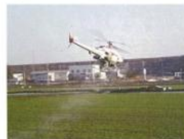
写真2 無人ヘリによる雪腐病防除