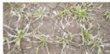
写真1 H24年発生した褐色雪腐病

雪腐病の発生は年次により差はありますが、平成24年は例年になく大雪と積雪期間が長く、JA北いしかりでは融雪の遅い地域、並びに滞水した圃場で雪腐病が発生し、秋まき小麦130haが廃耕になりました。特に例年発生が少ない褐色雪腐病(写真1)の発生が見られました。