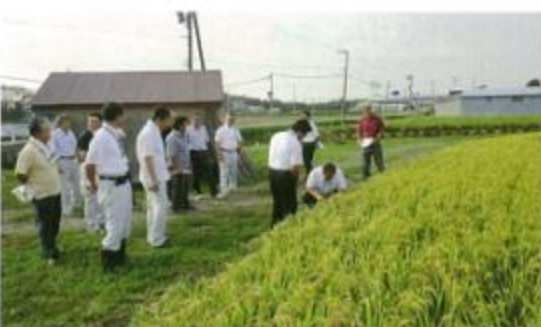
米の圃場を視察する役職員

9月14日、JA役職員による作況視察が行われました。 収穫直前の米やビート、大豆の圃場などを視察。去年からの大雪の影響による融雪の遅れのため、春の農作業に遅れが見られていましたが、夏は晴れの日が多く、湿度も高めで推移したため生育が追いつき、概ね良い作柄となりました。 参加者は上々の出来に期待を寄せながら視察を行っていました。